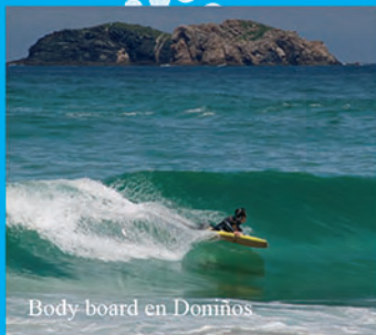
Body board en Doniños