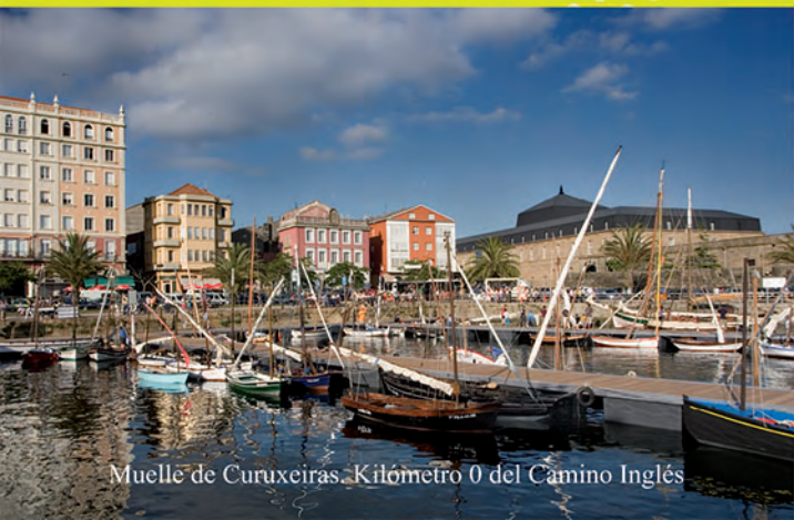
Muelle de Curuxeiras. Kilómetro 0 del Camino Inglés

Por el camino, monumentos medievales inolvidables, como los castillos de Pontedeume, el románico de Bremao, Tiobre, Santa María de Cambre y la monumental ciudad de Betanzos quedarán fijados en nuestra memoria para siempre.