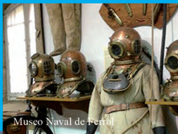
Museo Naval de Ferrol