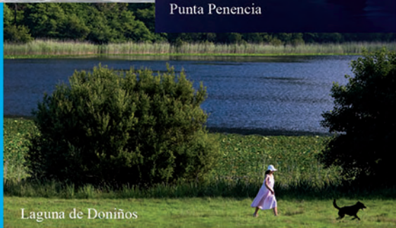
Laguna de Doniños