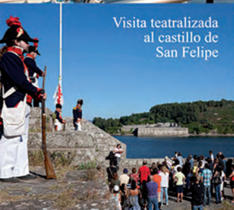
Visita teatralizada al castillo de San Felipe